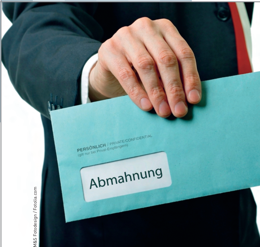
M&amp;S Fotodesign / Fotolia.com

REIHENWEISE versickt die Münchener Wettbewerbszentrale Abmahnungen an Bausachverständige und Sachverständige im Bauwesen